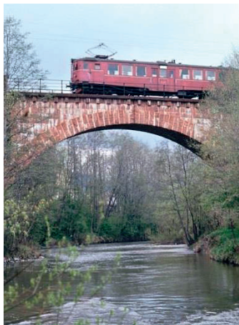
Jernbanebroen ved Lierbyen er fra 1915. Den erstattet en tidligere trebro. I dag er broen en del av omkjøringsveien rundt Lierbyen.

Utstillingen på Lier Bygdetun består av utvalgte bilder fra de siste ukene det gikk tog på den gamle traseen, som hadde vært i bruk helt fra Drammensbanen ble åpnet høsten 1872.