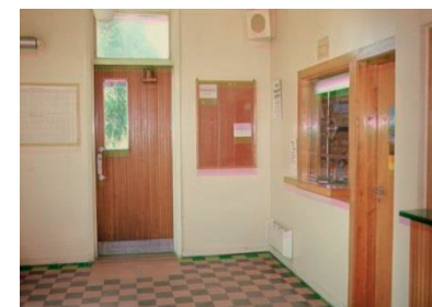
Venterommet på Lier stasjon hadde billettluke og høyttaler som ofte varslert om forsinkelser.