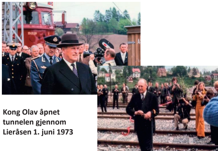
Kong Olav åpnet tunnelen gjennom Lieråsen 1. juni 1973

Senere ble det bestemt at den gamle traseen skulle brukes dels som avlastningsvei ved Lierbyen, dels som turvei for gående, syklende og ridende, og som skiløype.