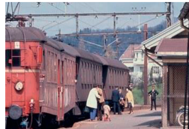
Hadde bedre tid: Et farvel og noen vennlige ord før lokaltog kunne fortsette fra Gamle Lier stasjon.