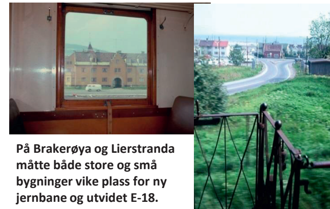
På Brakerøya og Lierstranda måtte både store og små bygninger vike plass for ny jernbane og utvidet E-18.

NÅ ER DET FØRTI ÅR SIDEN banen ble lagt om, og mange har bare hørt om togene som gikk på det som på en og samme tid var Liers lokalbane og trasé for fjerntogene til Vestfold, Sørlandet og Rogaland.