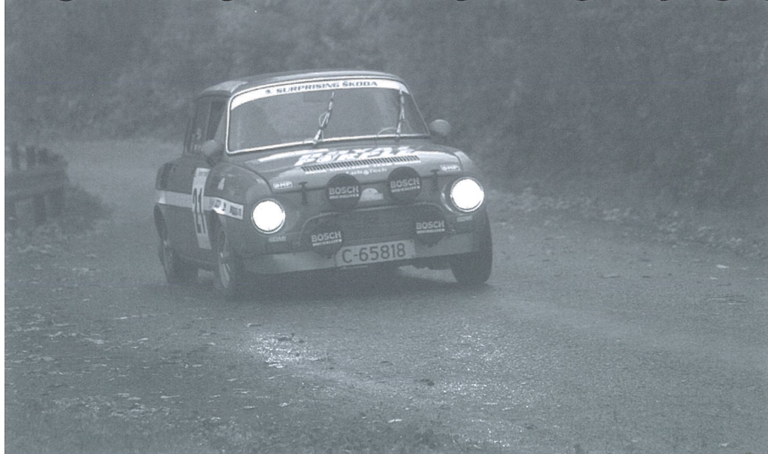
Roy og Steinar i fullt driv mot 3plass i Norges-cupen 2005