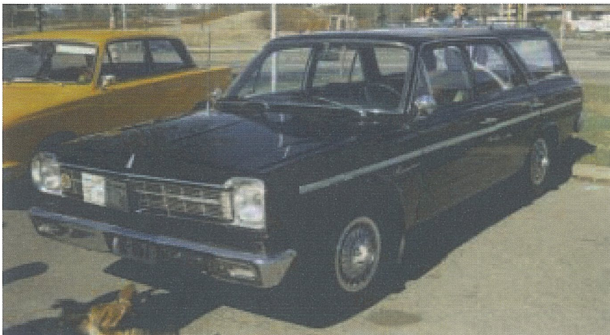
Rambler Am. Eier Inger Ulla