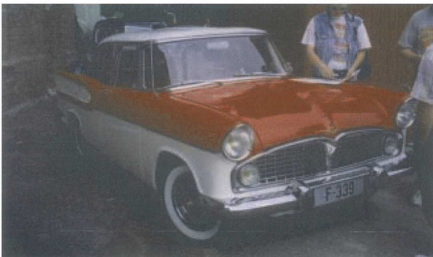
Simca. Eier Bertil Eastwood.