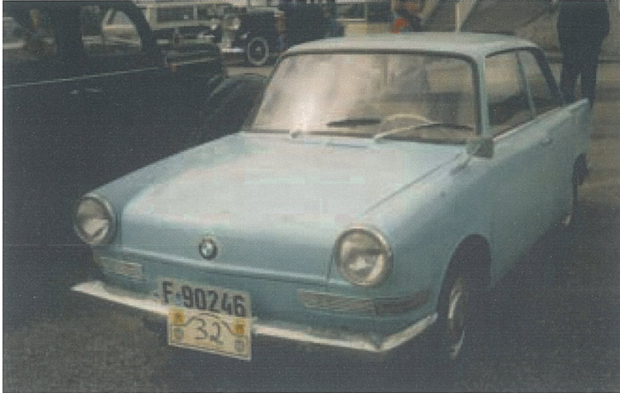
BMW 700. Eier Per Thorrud