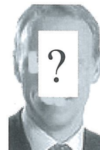
En fra styret