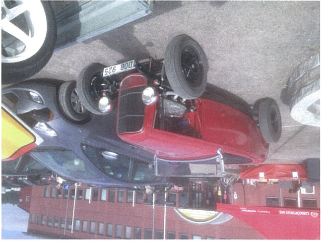
6 BILDER FRA SVIESTAD/LINKØPING