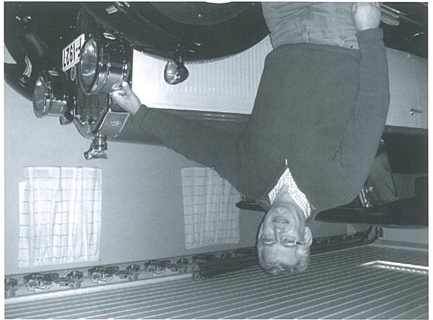
Formannen har ordet: